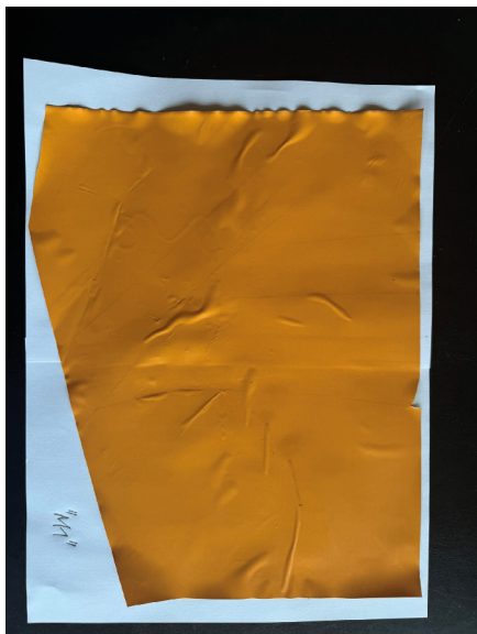
Abbildung 1 Folienmuster »M1« in Ordnung.

Es ist offensichtlich, dass die Färbung des Musters »M1« bei der Bestrahlung unverändert bleibt, während sich die des Musters »M2« verändert. Die deutlichste Veränderung bei Muster »M2« wird beim a-Wert festgestellt. Dieser nimmt ab, das heißt das Muster wird weniger rötlich. Der b-Wert ist nahezu konstant, und die Helligkeit (L-Wert) nimmt geringfügig zu. Obwohl in beiden Produktdatenblättern und Sicherheitsdatenblättern der beiden verwendeten Drucktinten keine technischen Unterschiede zu erkennen sind, unterscheiden sich die beiden Drucktinten hinsichtlich der Lichtechtheit deutlich. Die Drucktinte, mit dem das Folienmuster »M2« gedruckt wurde, ist für den Außeneinsatz als Werbeträger ungeeignet. ●