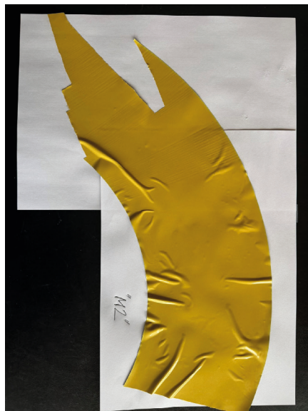
Abbildung 2 Folienmuster »M2« ausgebleicht.