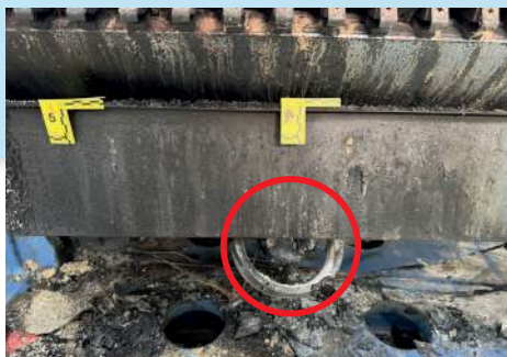
Abbildung 2 Brandbedingt herausgefallenes Gebläse (rote Markierung) aus Kammsauger des Druckwerks 2.