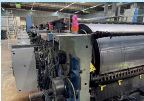
Abbildung 1 Unterbau mit Gegendruckzylinder des brandbeschädigten Druckwerks 1.

An einer großformatigen Bogenoffsetdruckmaschine kam es zu einem Brand während des Betriebs der Anlage. Die Mitarbeiter konnten eine Rauchentwicklung zwischen den Druckwerken zwei und drei feststellen. Da eigene Lösversuche nicht erfolgreich waren, wurde die Feuerwehr alarmiert, die schnell vor Ort war und mit Löschaum versuchte, den Brand zu bekämpfen. Anschließend wurde mit Wasser aus drei C-Schläuchen circa eine halbe Stunde gelöscht, bis das Feuer vollständig bekämpft war.