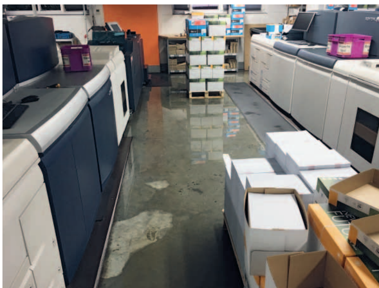
Abbildung 1: Wasserschaden im Drucksaal der Digitaldruckmaschinen.

ARRHENIUS BEZIEHUNG. Bei nicht stromlosen elektronischen Bauteilen, wie Platinen et cetera, kann es aufgrund der Kriechströme und leitenden