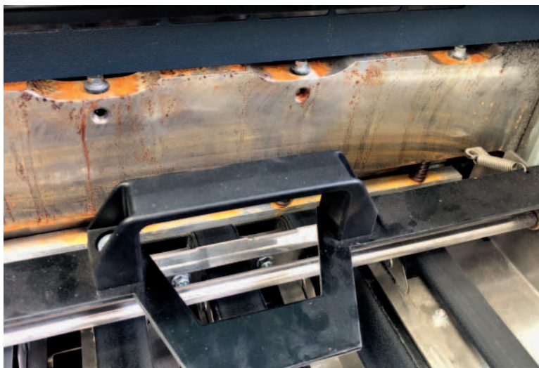
Abbildung 3: Korrosion an der Produktauslage der Druckweiterverarbeitung, verursacht durch eingedrungenes Stadtwasser.

Übergänge zu Überhitzungen einzelner Bauteile kommen. Daraus resultiert eine frühzeitige Alterung dieser betroffenen Bauteile. Diesen physikalischen Effekt der beschleunigten Alterung erläutert die Arrhenius Beziehung, benannt nach Svante August Arrhenius, schwedischer Physiker und Chemiker, der 1903 den Nobelpreis für Chemie erhielt.