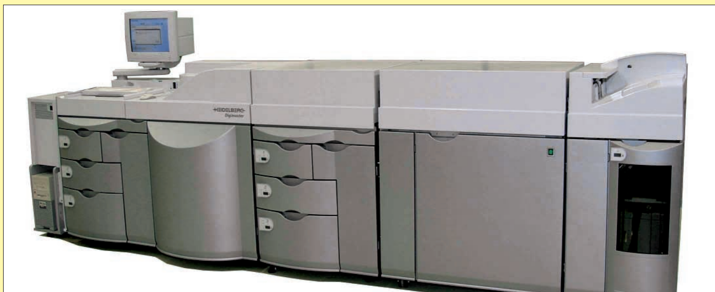
Volldigitalisiertes Schwarzweiß-Digitaldrucksystem der Baureihe Digimaster 9110 für Kleinauflagen und den personalisierten Druck.

In der ersten mündlichen Verhandlung fasste die zuständige Kammer (ein Vorsitzender Richter, zwei beisitzende Richter) des Landgerichts auf Antrag der Beklagten (Leasingnehmer = Dienstleistungsunternehmen) den folgenden Beweisbeschluss: »Es soll ein