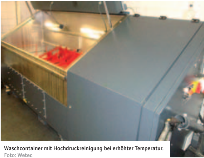
Waschcontainer mit Hochdruckreinigung bei erhöhter Temperatur.

der Keramikstäbe dringt Waschmittel seitlich radial durch diese Stäbe. Dabei sollen die Schmutzrückstände an den Innenwänden der Keramikfilterstäbe zurückgehalten werden. Bedarfsweise werden die Schmutzrückstände an den Innenwänden dieser Filterstäbe automatisch entfernt und einem Schmutztank zugeleitet. Messungen haben ergeben, dass der Filtrationsprozess mit Hilfe der Keramikstäbe circa zehn Mal so lange dauert im Vergleich zur Bandfiltration. Außerdem ist der Reinigungsprozess des so filtrierten Waschmittels lange nicht so effizient und ergiebig.