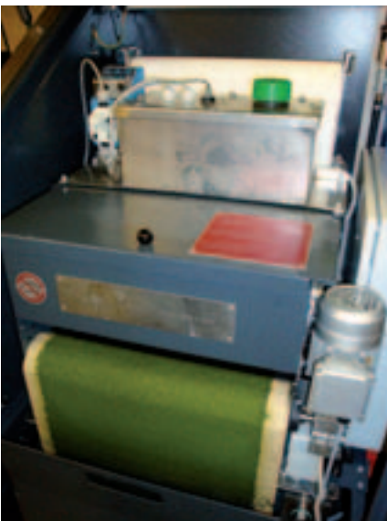
Automatische Bandfiltration im Waschcontainer.

Im Rahmen dieser Expertise wurden marktübliche Teilewaschanlagen bzw. Waschcontainer praxisgerecht in verschiedenen Druckereien untersucht und bewertet. Mit Abstand hat in allen Punkten (Funktionalität, Wirtschaftlichkeit, Filtration, Ökologie und Zulassung durch Berufsgenossenschaft) der Waschcontainer basierend auf Hochdruckreinigung bei erhöhter Temperatur deutlich gewonnen. ☺