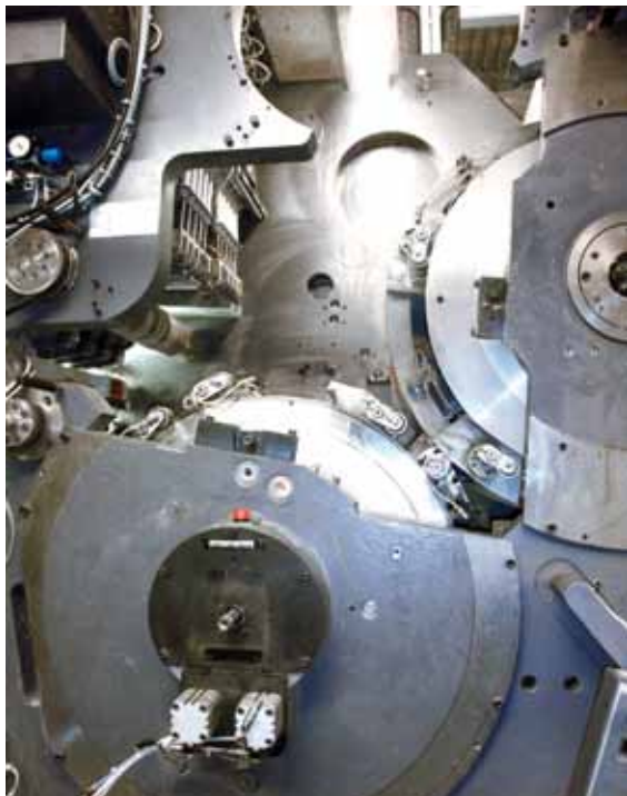
Abbildung 1: Falzapparat mit Sammelzylinder.

Ansinnen der Maschinenbruchversicherung war es, den Schaden möglichst auf den Maschinenhersteller abzuwälzen, da ja die Druckmaschine noch in Gewährleistung ist. Der Gutachter der Versicherung behauptete, er könne an den abgebrochenen Befestigungsschrauben für den Schneidgummi-