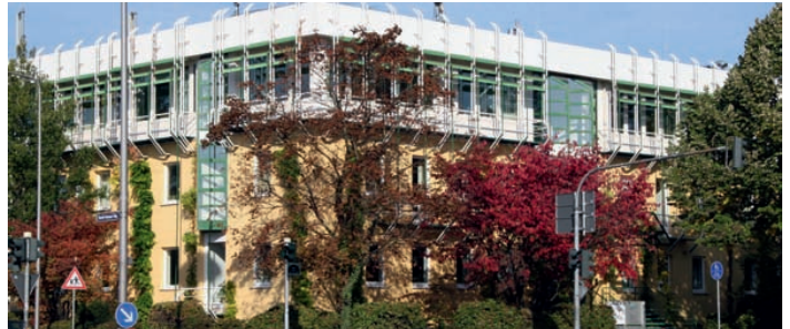
Das Gebäude des BVDM in Wiesbaden wird verkauft, der Verband zieht nach Berlin.

„Die Europäisierung und Globalisierung erfordern einen stärkeren